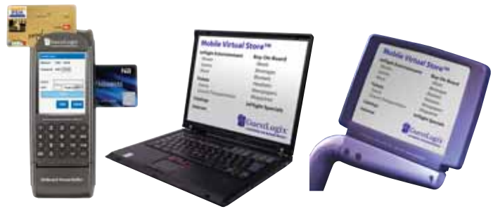
GuestLogix的POS接口可以与各种设备连接。

GuestLogix可实现现金、信用卡、借记卡、会员优惠卡和赠券支付的销售，使用的工具是其专有的POS手持式设备、椅背显示器或乘客自己的设备。机上自动化销售交易可为预测、减少与现金和存货相关的欺诈以及管理乘务人员的销售奖励提供重要数据。